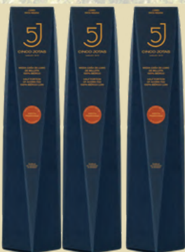
Caña de Presa Canister Cinco Jotas