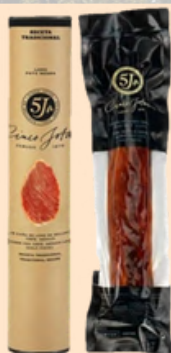
Caña de Lomo Canister Cinco Jotas