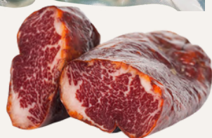
Lomito de presa MSC Delicatessen