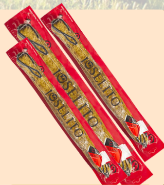
Caña de Lomo Joselito